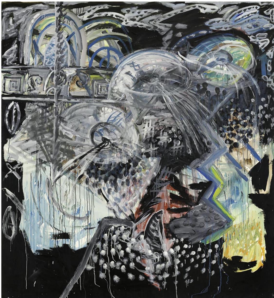
Artur Stoll, o.T., 1983, Nachlass Stoll, Foto: Bernhard Strauss