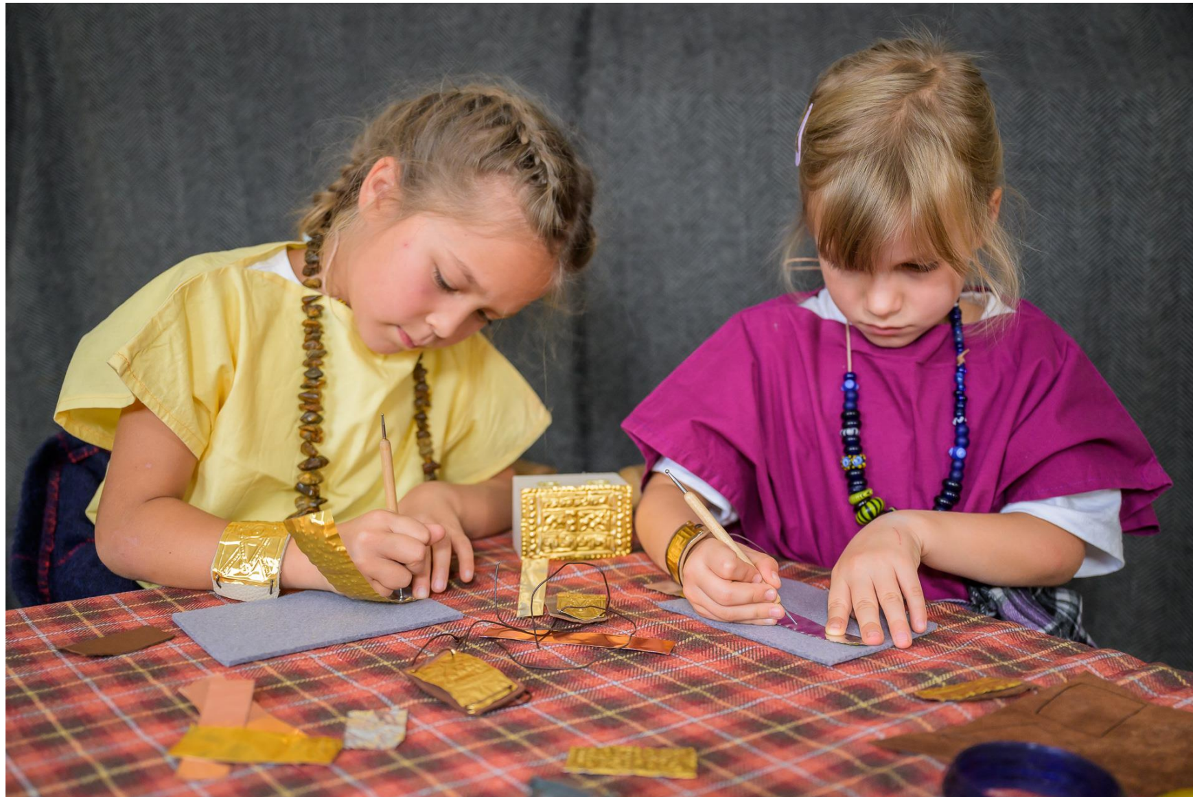
Colombischlössle-Fest, Fertigen von keltischen Armbändern, Foto: Marc Doradzillo