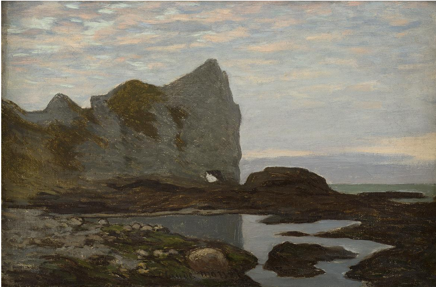
Claude Monet, Étretat, um 1864