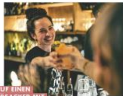
AUF EINEN ABSACKER MIT „SCHRÖDER“

Das urig-gemütliche „Café Ruef“ auf der Karthäuserstraße ist Restaurant und Bar in einem und hat fast rund um die Uhr geöffnet. Perfekt für Nachtschwärmer! Serviert wird italienische Küche, aber auch frische Backwaren und hausgemachte Drinks stehen auf der Karte, wie z. B. „Schröder“, ein Wodka mit Schwarzeinfusion, Zitrone, Minze und Mate. Berühmt-berüchtigt ist die Freiburger Institution außerdem für ihr Absacker-Frühstück an den Wochenenden. ruef-naherholung.de