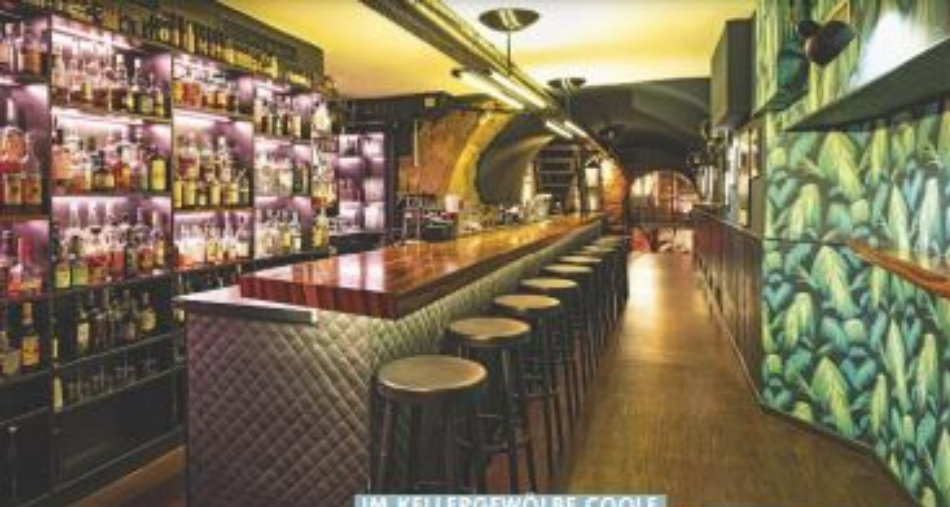
IM KELLERGEWÖLBE COOLE COCKTAILS KOSTEN