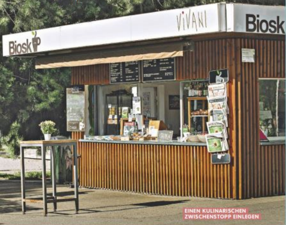
EINEN KULINARISCHEN ZWISCHENSTOPP EINLEGEN

Hier treffen sich Radler und Spaziergänger zur Outdoor-Kaffeepause